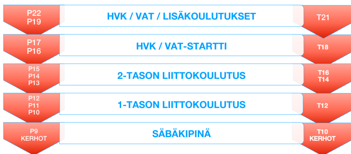
Kuva 5. SPV-valmentajan koulutuspolku

Seuramme kerhonohtajille toteutetaan koulutusta elo-syyskuussa 2026. Joukkueenjohtajille ja rahastonhoitajille suunnattua toimihenkilökoulutusta järjestetään syksyllä -26. Kannustamme joukkueidemme toimihenkilöitä salibandyliiton viralliseen toimitsijakoulutukseen . Seuramme valmentajille löytyy valmennuslinja sekä kerhonohtajille ja toimihenkilöille oppaat arjen perehdytykseen seuran kotisivuilta.