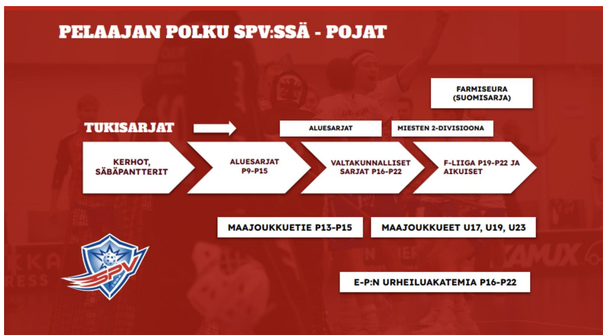
Kuva 3-4. SPV:n poikien ja tyttöjen pelaajapolut